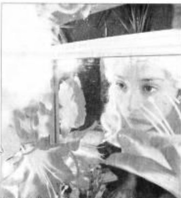
"EN EL OTRO PATIO" — Dos actrices se hacen cargo de jóvenes que están solos en un centro terapéutico, buscando recuperarse de sus dolores.

Jacqueline Roumeau impulsa este proceso, y luego de montar con personas privadas de libertad las obras de teatro "Pabellón 2-rematadas" y "Collina I", generó la primera red de teatro carcelario en Santiago.