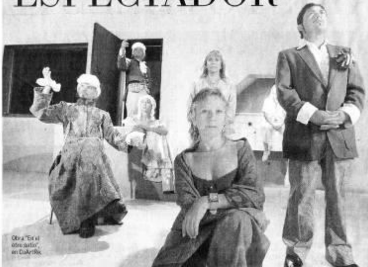
Obra "En el otro patio", en CoArtRe.